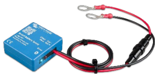
Smart Battery Sense Permite la carga con compensación de temperatura y tensión.