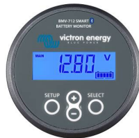
Monitor de baterías BMV-712 Smart